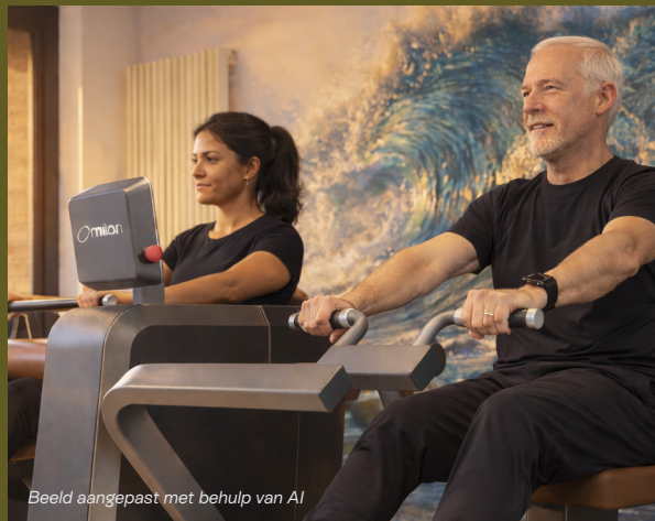
Beeld aangepast met behulp van AI

Bij Autonomycs vertrekken we vanuit wetenschap, maar werken we van mens tot mens. Je traint in kleine groepen op een digitaal krachtcircuit, met een persoonlijk programma dat afgestemd is op jouw mogelijkheden en doelen.